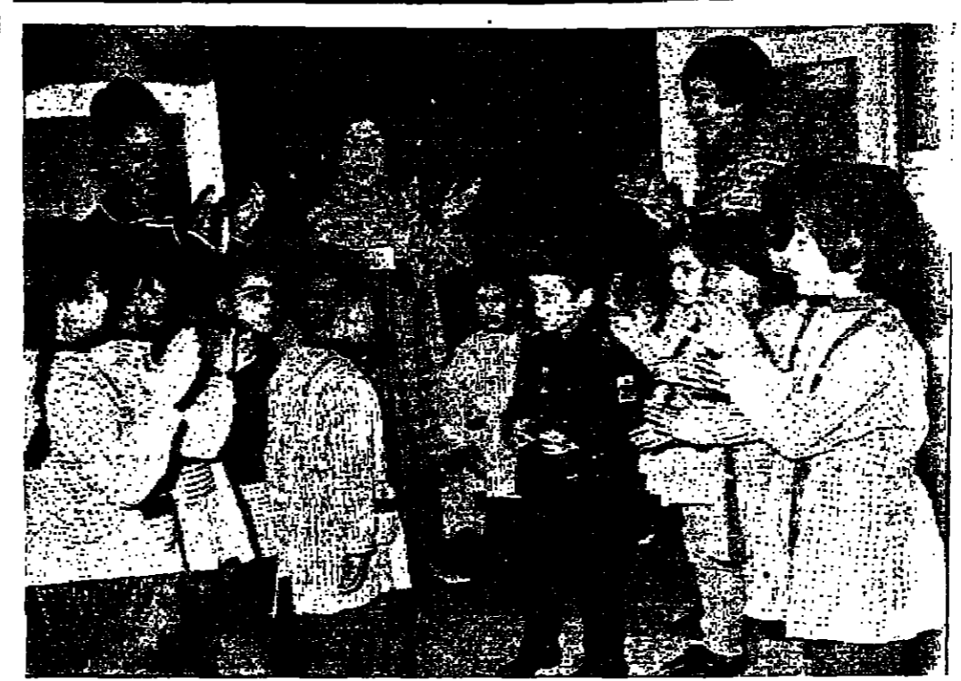
شهد من احتفال روضة الاطفال في الكلية العلمية الاسلامية بعد جلاسو الامير عبد الله المعظم ويرى الى جايه سموه شقيقه سمو الامير فيصل المعظم كما ترى في الصورة التمام ابيته عرفات حيدرة المروضة والامسة حديد الرفاعي الشرفة على صف سمو الاميرة هدى ابو نوار المشرفة على ركن الطفل في الازاعة

لوس انجليس - رويتر - ذكر حلاق غاز اخيرا بلقب رجل العام في ميته ان الرئيس جولسون يصف طريقته جديدة في تصفيف شعره بتيج اخفاء عيوب في الرأس -